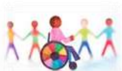
Фото отчет участия в сетевом взаимодействии