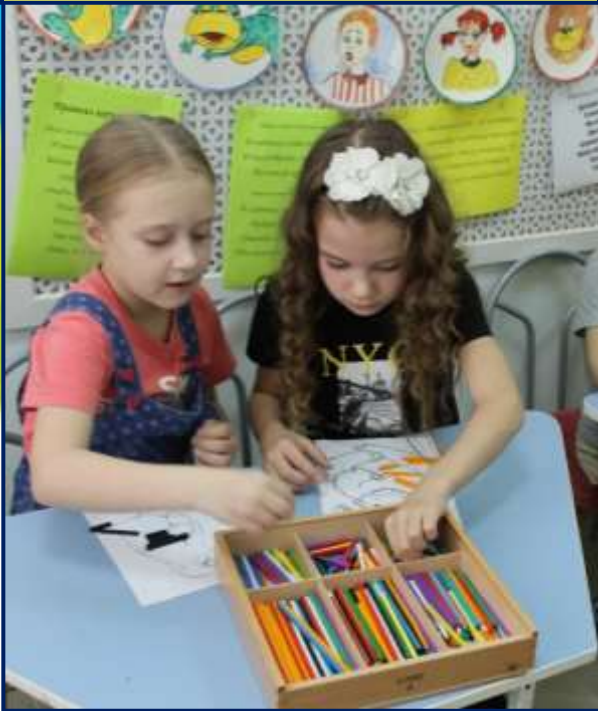
Дидактическая система Ф. Фребеля